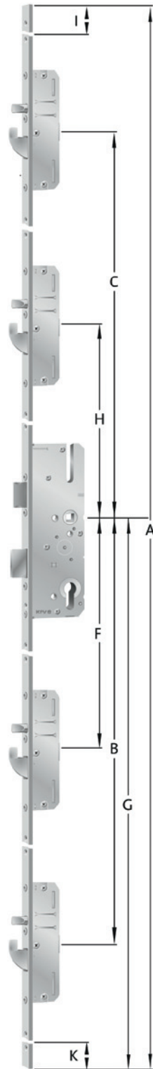
Schwenkriegel mit oder ohne Rundbolzen